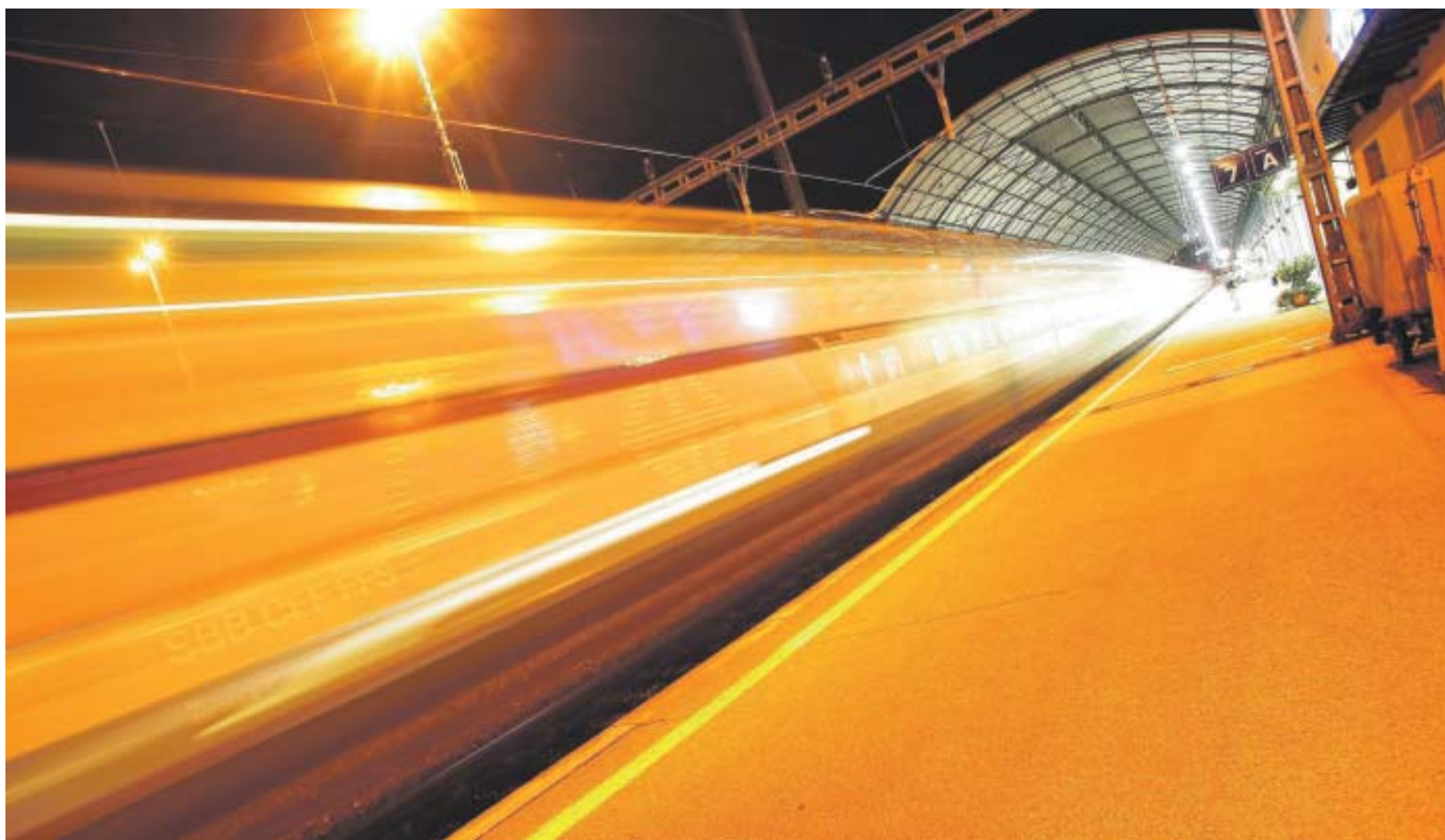
Bahnhof Olten: Politiker aller Parteien wollen für die Bahn-Infrastruktur im Mittelland vier Milliarden Franken mehr